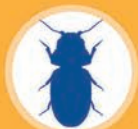
Малый табачный жук